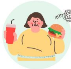
적정 체중과 허리둘레 유지하기