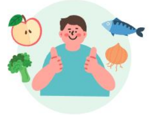
규칙적이고 균형잡힌 식단