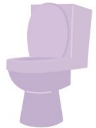
소변을 자주 봄

당뇨병은 초기에는 특별한 증상이 없는 경우가 많아 스스로 알아차리기 어려운 질환입니다.