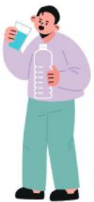
물을 자주 마심